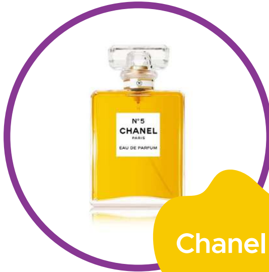
Chanel No. 5