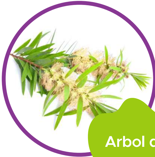
Arbol de Té