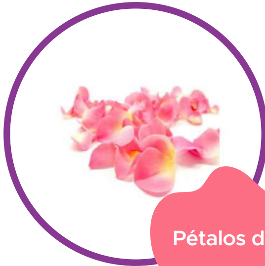
Pétalos de Rosa